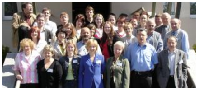
Účastníci tréningu, jún 2005, Riga.

Ďalšia etapa projektu sa realizovala v dňoch 30.05.-03.06.2005 v Rige za účasti zástupcov verej-